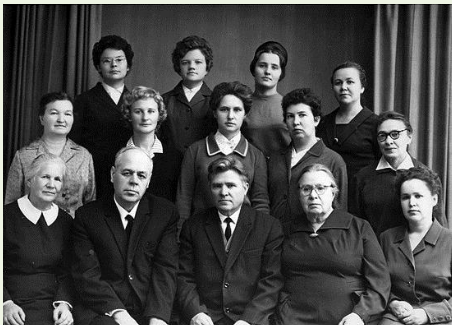
Коллектив кафедры морфологии и систематики растений, 1967 г.

«Антоэкология растений темнохвойной тайги».