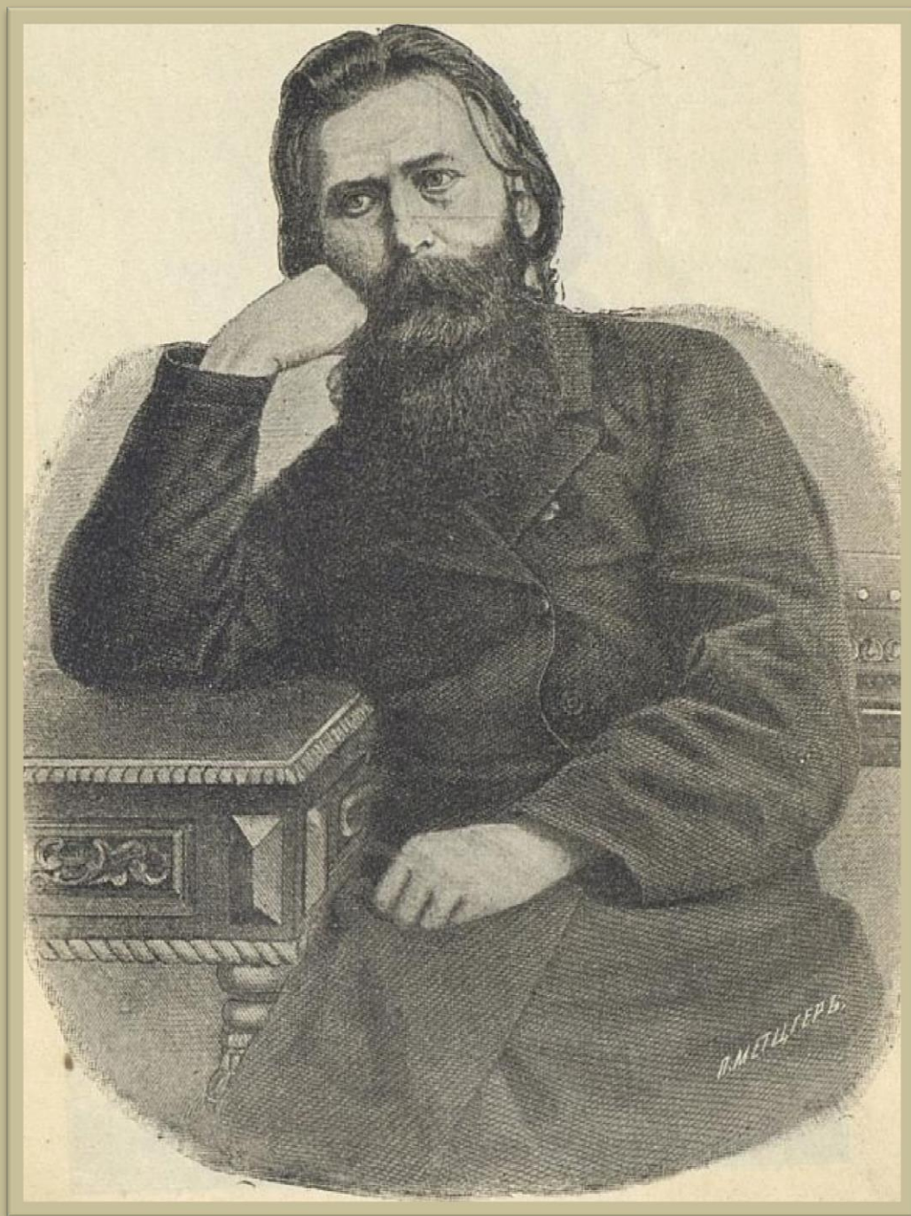
Иван Захарович Суриков русский поэт-самоучка 1841-1880