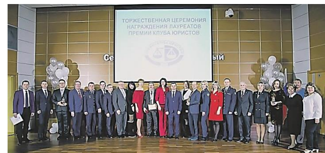
Торжественная церемония награждения лауреатов премии Клуба юристов, 2018 г.

Является членом Научно-консультативного Совета при Пермском краевом суде.