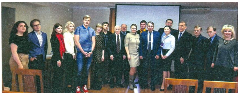
Участники круглого стола «Конституционно-правовые основы цифровизации государственного и муниципального управления» в рамках IX Пермского конгресса учёных-юристов 2018 г.